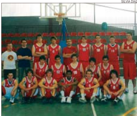
>> Els júnior i cadets que participaran al Campionat