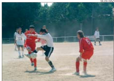
>> El derbi juvenil es va jugar al camp de la Font Freda