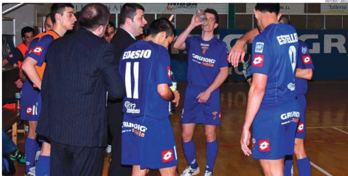
>> El Montcada s'ha consolidat com un dels equips amb més prestigi de la Divisió de Plata a nivell nacional

Hores d'ara els integrants de la primera plantilla intensifiquen les negociacions per jugar la propera temporada en altres equips. Segons ha pogut saber Montcada Ràdio, el