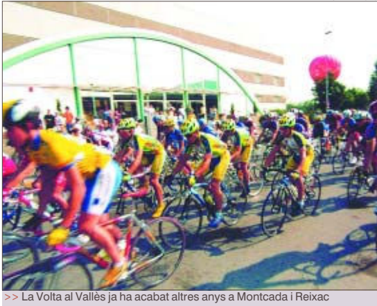
>> La Volta al Vallès ja ha acabat altres anys a Montcada i Reixac