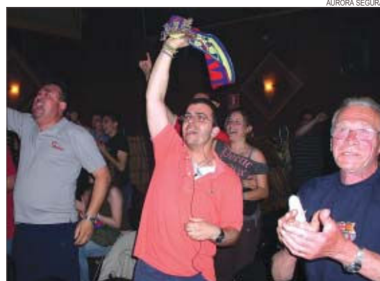
>> Aficionats celebren la victòria del Barça al Casino de Terra Nostra

D'altra banda, el Reial Club Esportiu Espanyol i l'Institut Municipal d'Esports i Lleure (IME) van regalar entrades per veure a l'estadi olímpic Lluís Companys el darrer matx de lliga entre el club blanciblaui i la Reial Societat. L'IME va repartir més de 800 tiquets, que es van esgotar en només dos dies. L'afició montcadenca va viure en directe el final agònic d'un partit en què l'Espanyol va aconseguir la permanència a Primera Divisió amb un gol de Corominas al minut 91.