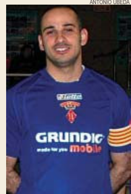
>> Jeff s'acomia

No ho descarto. Aquí em sento molt bé. LM