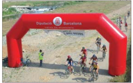
>> Els ciclistes locals es van incorporar a l'alçada del pont de la Roca