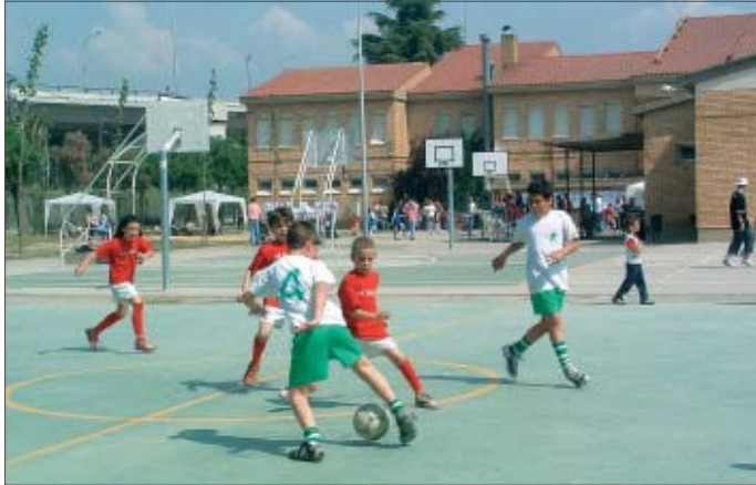
&gt;&gt; Els col·legis han celebrat durant maig la seva festa. A la foto, futbol sala al Font Freda

Els centres i clubs que participaran en la jornada seran: El Viver, Turó, Mitja Costa, Font Freda, Elvira Cuyàs, Reixac, La Salle, Sagrat Cor, La Ribera, La