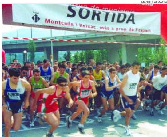
>> La sortida de la cursa de Festa Major de l'any passat

Nou curses. La Milla es dividirà en nou proves segons les categories. Els primers classificats de cada categoria i el primer local masculí i femení de cada modalitat rebran un trofeu. A la Milla Open obtindran també guardó el primer, segon i tercer classificat, tant masculí com femení, sense distinció de categoria. Per a la categoria absoluta, masculina i femenina, hi haurà un premi en metàl·lic de 125 euros per al primer classificat, 75 euros per al segon i 50 euros per al tercer arribat. Tots els participants rebran un obsequi. A banda de la novetat de la milla, la JAM té previst organitzar una cursa de muntanya d'uns 10 quilòmetres i amb pujada al Turó de Montcada. "No hi ha una data fixada perquè ho hem d'acabar de valorar", ha comentat Abián, qui considera que a la ciutat falta una prova d'aquestes característiques que normalment tenen força acceptació entre els corredors de curses populars.