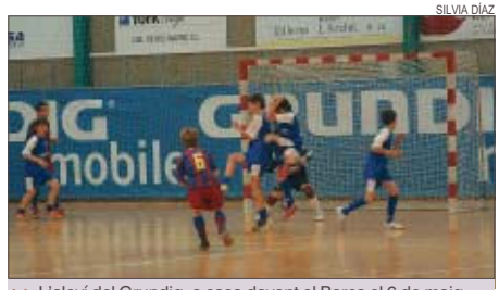
>> L'alevi del Grundig, a casa davant el Barça el 6 de maig

El cadet A del Grundig Mobile va caure derrotat davant el Barça (7-0) en el primer partit de la Final de Catalunya cadet, que es va disputar el 13 i 14 de maig a Santa Coloma.